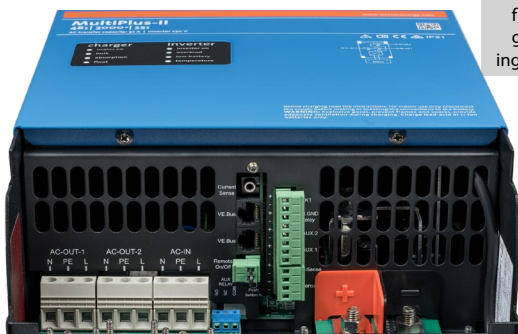
Area di connessione